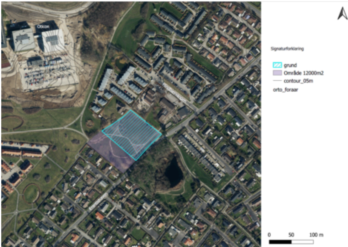
Billede: Forslag til placering af 7.500 m 2 grundareal for institutionsformål ved Erantishaven vist med turkis skravering