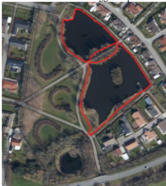
Figur 1. Kommunale matrikler er markeret med rødt. Luftfoto fra 2021.

I april 2020 modtog Egedal Kommune en henvendelse fra en borger om fejlagtig skiltning ved Kildesøerne i Ølstykke, der viser, at det er ulovligt at fiske i søerne. Kildesøerne er en del af spildevandssystemet, som driftes af Novafos, og søerne ejes af Egedal Kommune. Grundet ejerforholdet er det lovligt, jf. Regler for fiskeri i søer ejet af Egedal Kommune, at fiske heri. Søerne er beliggende på matr.nr. 12sn og 12so Ølstykke By, Ølstykke.